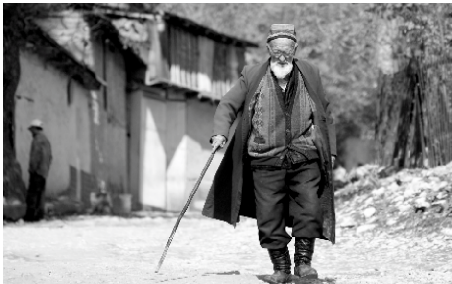
Мужчина идет на рынок в деревне Арсланбоб, Кыргызстан

Еще одной серьезной проблемой явилось сокращение объема донорского финансирования в последние годы. Учитывая тот факт, что Кыргызстан обладает минимальными альтернативными источниками финансирования, вопрос выживания НПО, особенно малых и сельских, стал еще более сложным. Государство крайне чувствительно реагирует на деятельность НПО по правам человека и «активистских» неправительственных организаций, но вместо этого заявляет о своей поддержке «социально-ориентированных НПО». Однако в реальности НПО социального сектора получают мало ощутимой поддержки от государства. Поэтому, они находятся в двусмысленной ситуации. Несмотря на разговоры о сотрудничестве с государством эти НПО не получают большой поддержки, и все же когда они предпринимают попытки к сотрудничеству с органами государственной власти, они слышат в свой адрес критику от других участников сектора НПО за свою излишнюю лояльность к государственной власти. С другой стороны, власти на государственном, и особенно местном уровне, зачастую