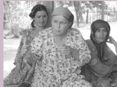
Члены женской группы самопомощи в Таджикистане.

Политическая активность женщин в регионе остается ограниченной «предложенными зонами» (invited space) участия, где определенные группы участвуют в определенном качестве так, что это не меняет каким-либо значительным образом традиционные соотношения сил. Такое положение в немалой степени связано с тем, что основные стратегии женских НПО формируются под влиянием международных агентств развития, и которые, как правило, ограничиваются «регистрацией нужд» женщин как,