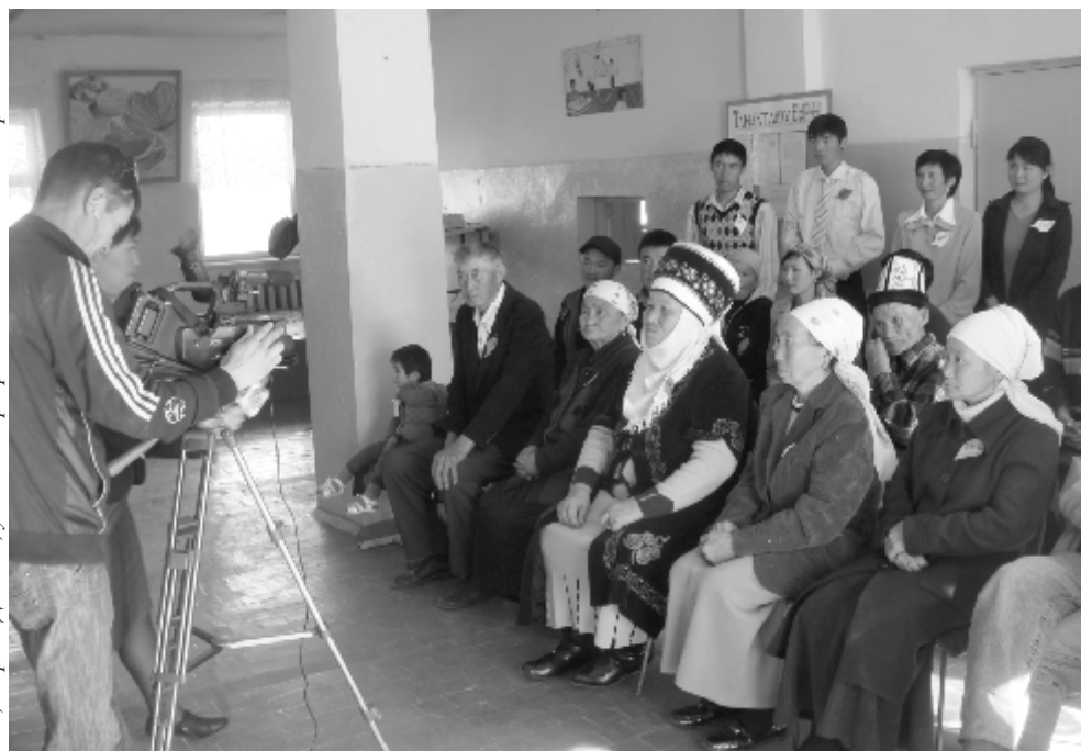
Сельские жители Кыргызстана на фотовыставке, посвященной проблемам сельской молодежи

Мы хотели бы выразить особую благодарность нашим коллегам из офиса ИНТРАК в Бишкеке, а также нашим партнерам по всему региону, за их работу по подготовке этого выпуска ОНТРАК в сложных условиях.