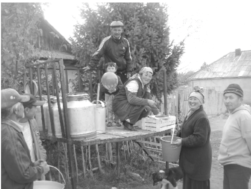
Сельская жизнь на Иссык-Куле, Кыргызстан

В качестве второй цели ИНТРАК видит сотрудничающие организации, деятельность которых ориентирована на сокращение бедности и гендерное равенство, чтобы «продолжить оказывать местным НПО партнерам и социальным движениям содействие в наращивании потенциала» в целях повышения «участия и усиления роли уязвимых и обособленных социальных сообществ». Наша работа по данной цели в основном проводится в Кыргызстане и Таджикистане, беднейших странах региона, которые наиболее зависимы от внешней помощи. Большинство международных доноров покинуло Казахстан в 2005 году, ссылаясь на увеличение ВВП на душу населения. Местные эксперты по гражданскому обществу и развитию оспаривают данный взгляд, отмечая отказ режима делиться своим нефтяным богатством и замедленный процесс демократизации. На самом деле, многие местные НПО вынуждены закрываться или продавать свои услуги правительству в качестве тренеров и консультантов.