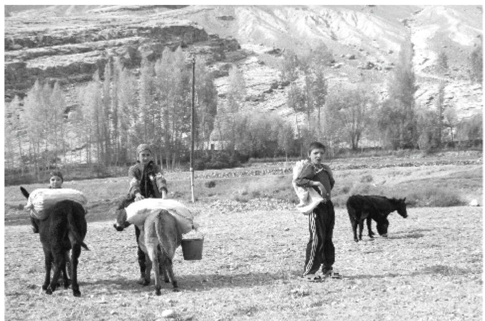
Дети в долине Вахан, на границе Таджикистана и Афганистана

Менеджер Программы ИНТРАК в Центральной Азии, charlesb@intrac.kg