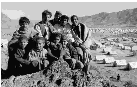
Лагерь беженцев в Северном Пакистане.

В то время как некоторые районы получали больше помощи, чем другие, многие городские НПО представили большое количество разоблачающих отчетов об очень ограниченной деятельности по оказанию помощи, особенно в районах, представленных как «закрытые», что представлялось, как бессердечная готовность поставить под удар жизни жертв землетрясения, нежели открыть изолированные территории для предоставления помощи, и скрыть судьбу этих районов от глаз общественности. Отчеты также подробно описывали, как государство было вовлечено в крупномасштабную утерю и незаконное использование средств помощи, и отсутствие прозрачности и подотчетности.